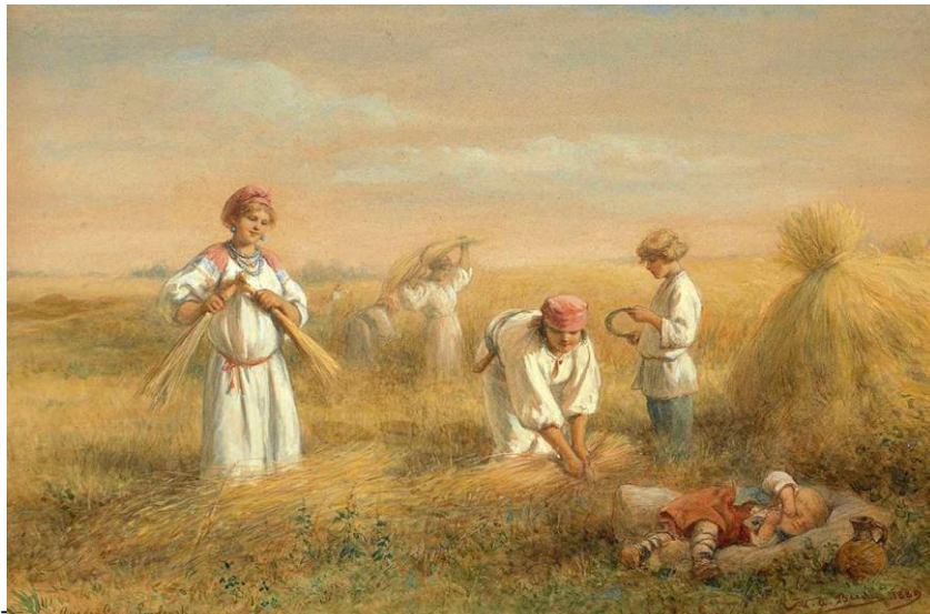
"ברמה" עלון למידע מס' 1894, כה' בסיוון תשע"ט, 28/6/2019, קיבוץ רמת יוחנן